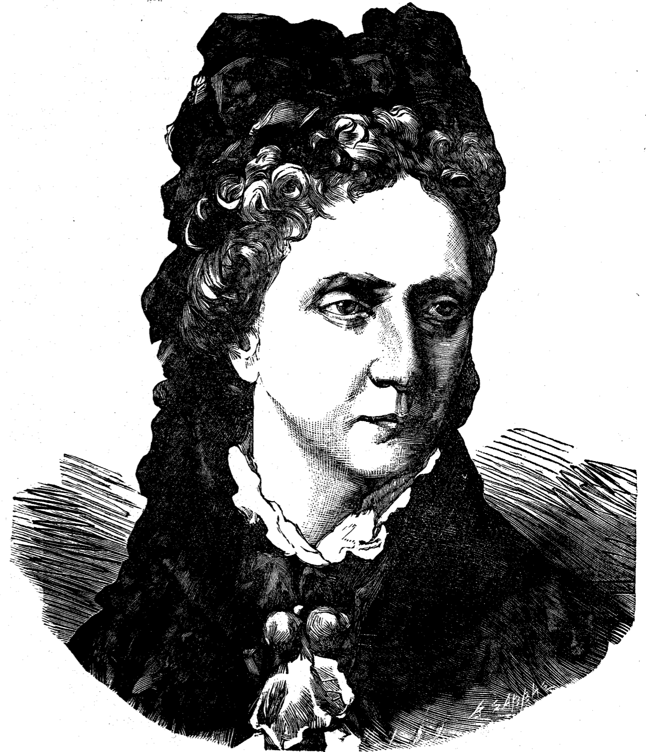
ΜΑΡΙΑ ΑΛΕΞΑΝΔΡΟΒΝΑ αὐτοκράτειρα τῆς Ῥωσίας

γράμμα τοῦ κυρίου Στεφάνου Ξένου (Παγκόσμιος Ἐκθεσις), «παριστᾶ γυμνὸν ἄνδρα ἡμισκυμμένον καὶ κρατοῦντα ἀπὸ τὸν κρίκον κύνα ὄρητικόν, θέλοντα ν' ἀφελθῇ κατόπιν τοῦ θηρεύματος. Ἡ δὲ φυσιογνωμία τοῦ ἀγάλματος φαίνεται καὶ αὐτὴ ἐπίσης προσηλωμένη μακρὰν πρὸς τὴν θήραν. Ὁ Ἕλλην κυνηγὸς εἰς τὴν ἀριστερὰν χεῖρα κρατεῖ τεμάχιον δόρατος.»